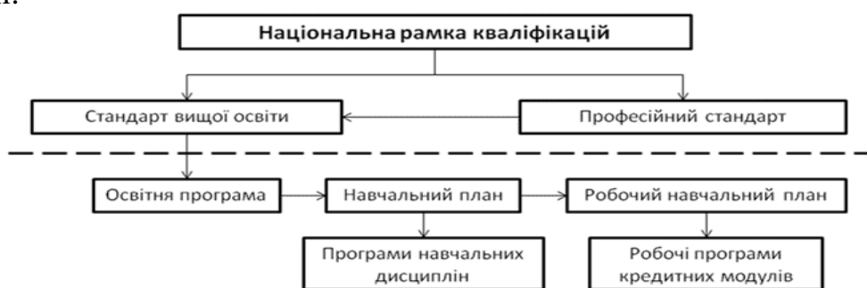
Рис. 1. Структура розроблення змісту освіти і навчання

Нормативні документи верхньої частини схеми (національна рамка кваліфікацій, професійні стандарти та стандарти вищої освіти) розробляються на рівні держави і затверджуються відповідними державними органами. Документи нижньої частини схеми розробляються й затверджуються в Коледжі.